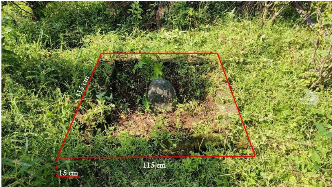
Foto 2. Batu Tetenger di Eks Pabrik Soember Nilo Tambak dengan pembatas dari pasangan batu bata