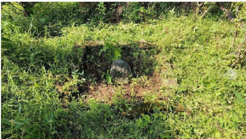
Foto 1. Batu Tetenger di Eks Pabrik Soember Nilo Tambak