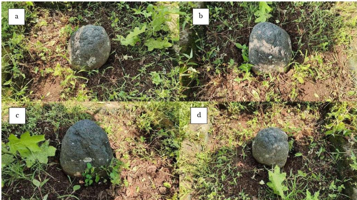
Foto 5. Batu Tetenger dilihat dari beberapa sisi