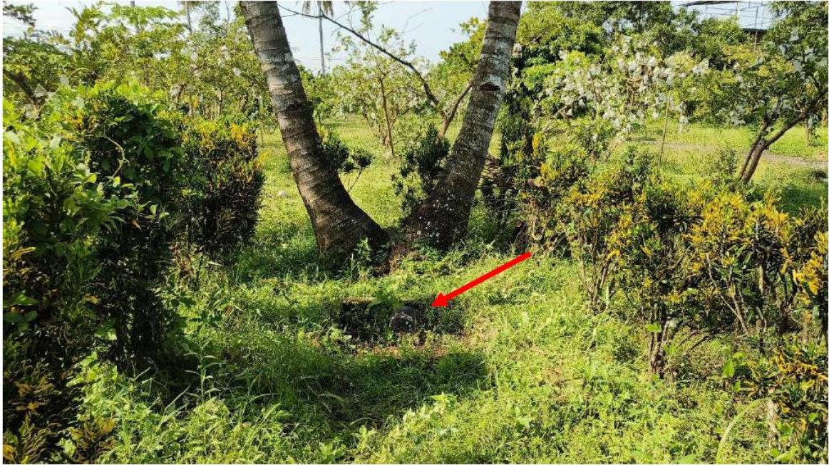
Foto 6. Kondisi eksisting lingkungan di sekitar Batu Tetenger