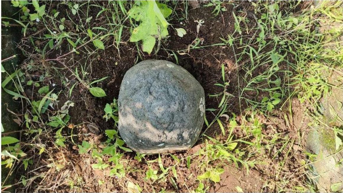
Foto 4. Batu Tetenger dilihat dari atas Sumber: Dinas Kebudayaan ( Kundha Kabudayan ) Kab. Kulon Progo, 2025