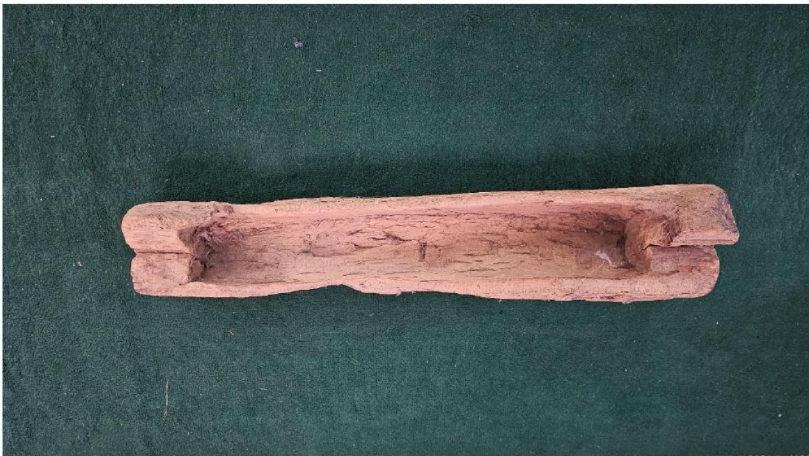
Foto 1. Kentongan Masjid Kedondong (Sunan Kalijaga)