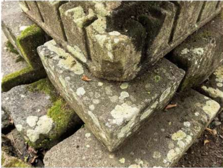
Foto 3. Komponen Batu Candi 4 Bagian Sudut Struktur Candi Pringtali tampak atas