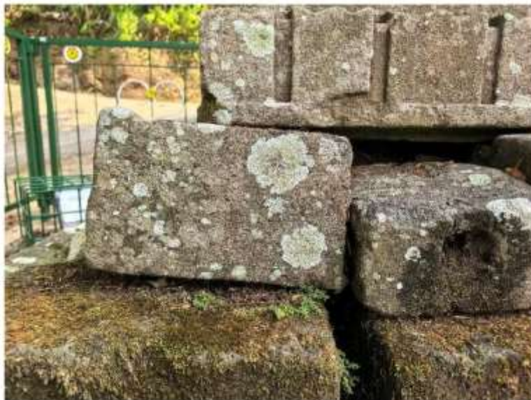
Foto 4. Komponen Batu Candi 4 Bagian Sudut Struktur Candi Pringtali tampak belakang