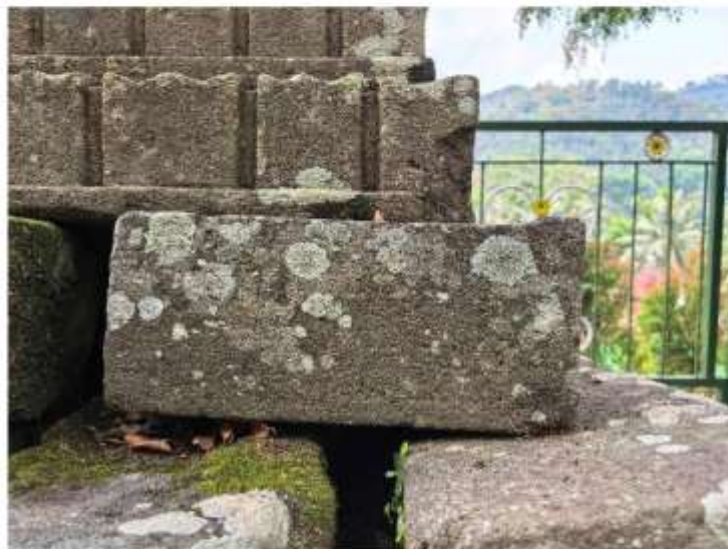
Foto 1. Komponen Batu Candi 4 Bagian Sudut Struktur Candi Pringtali