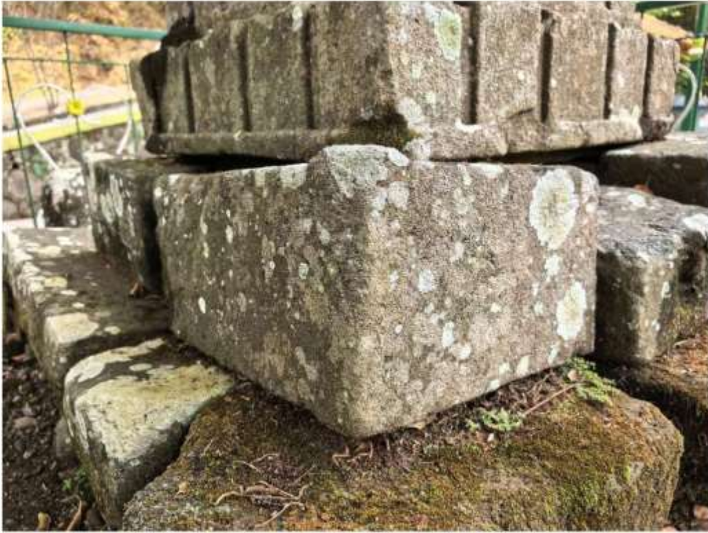
Foto 5. Komponen Batu Candi 4 Bagian Sudut Struktur Candi Pringtali tampak atas