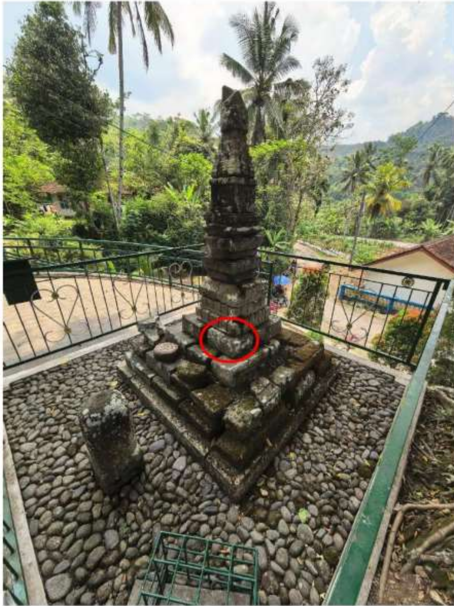
Foto 2. Komponen Batu Candi 4 Bagian Sudut Struktur Candi Pringtali dalam susunan struktur