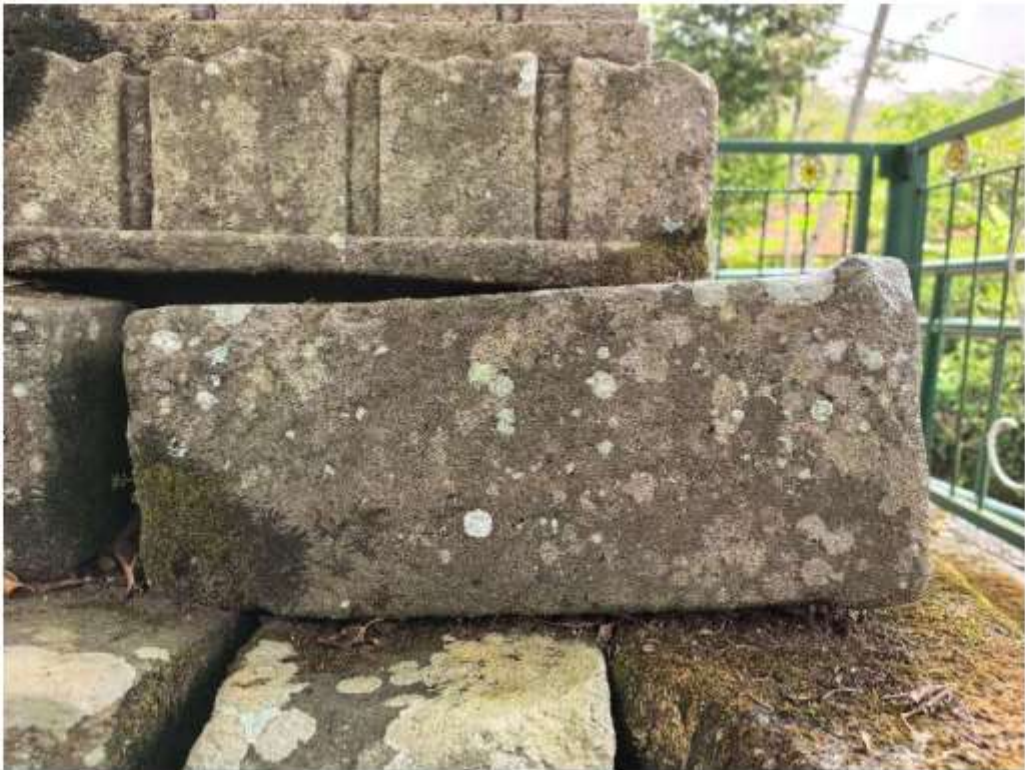
Foto 5. Komponen Batu Candi 5 Bagian Sudut Struktur Candi Pringtali