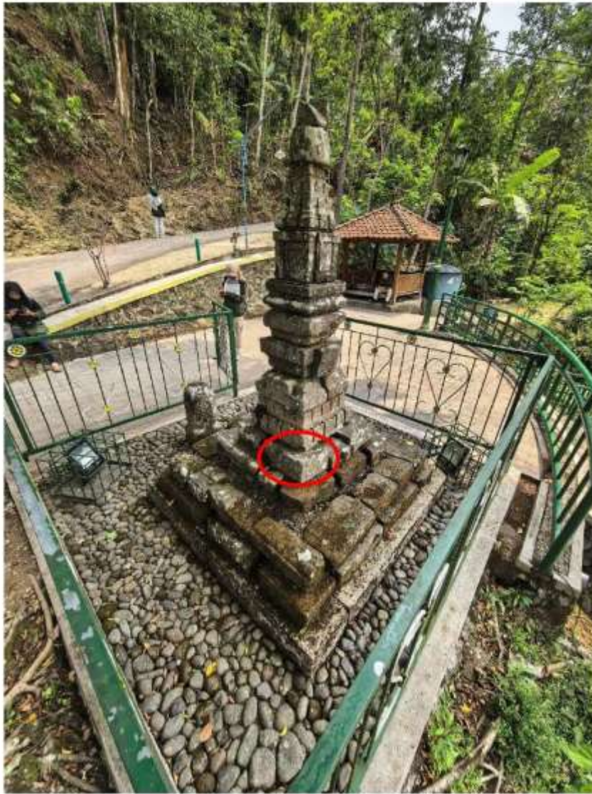
Foto 3. Komponen Batu Candi 5 Bagian Sudut Struktur Candi Pringtali