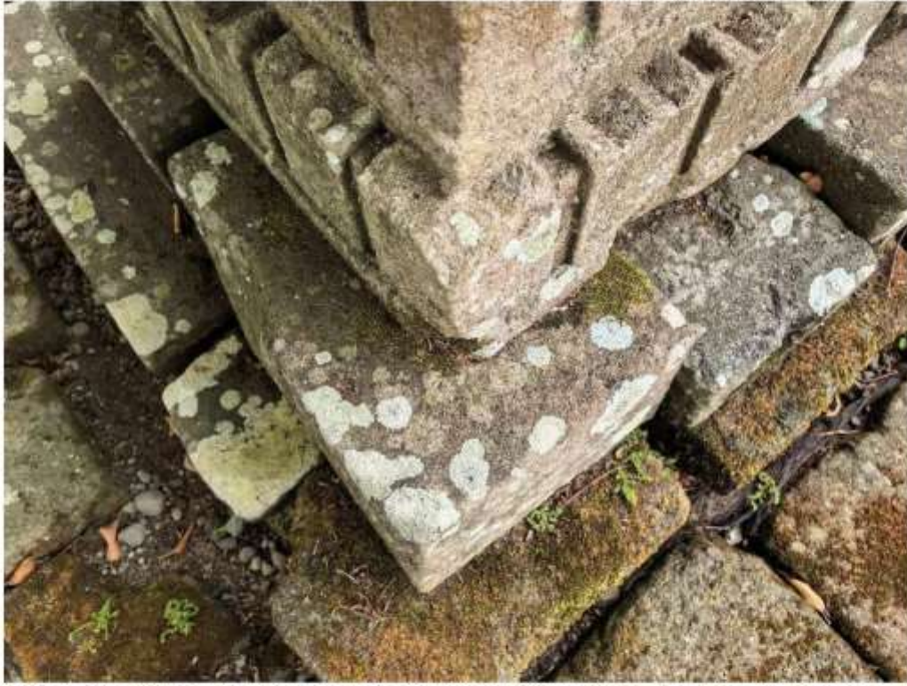
Foto 6. Komponen Batu Candi 5 Bagian Sudut Struktur Candi Pringtali tampak atas