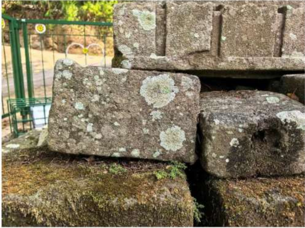
Foto 4. Komponen Batu Candi 5 Bagian Sudut Struktur Candi Pringtali