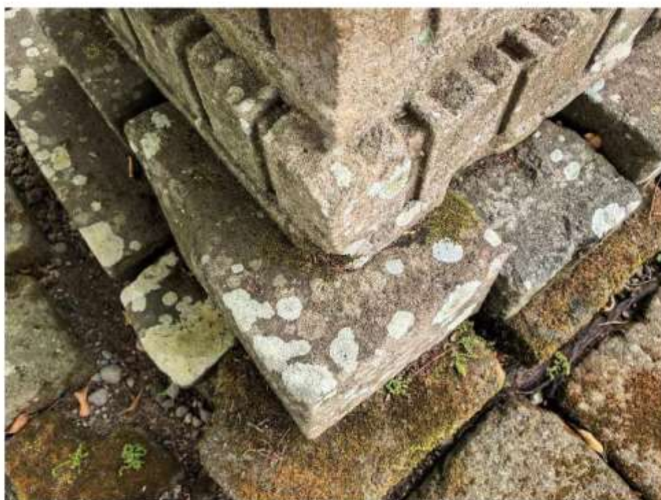
Foto 1. Komponen Batu Candi 5 Bagian Sudut Struktur Candi Pringtali