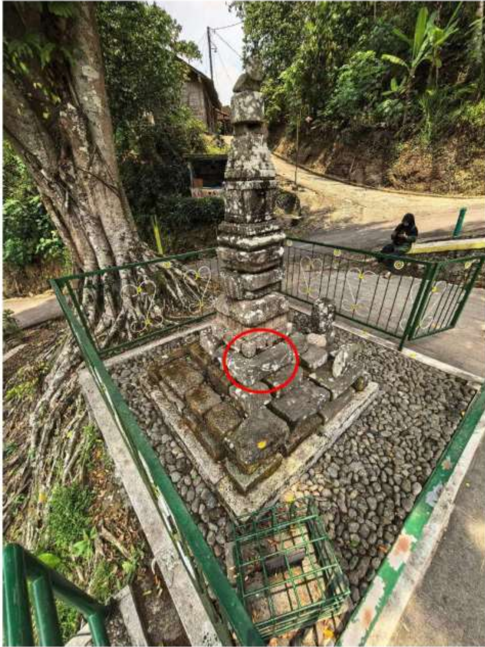
Foto 3. Komponen Batu Candi 6 Bagian Sudut Struktur Candi Pringtali