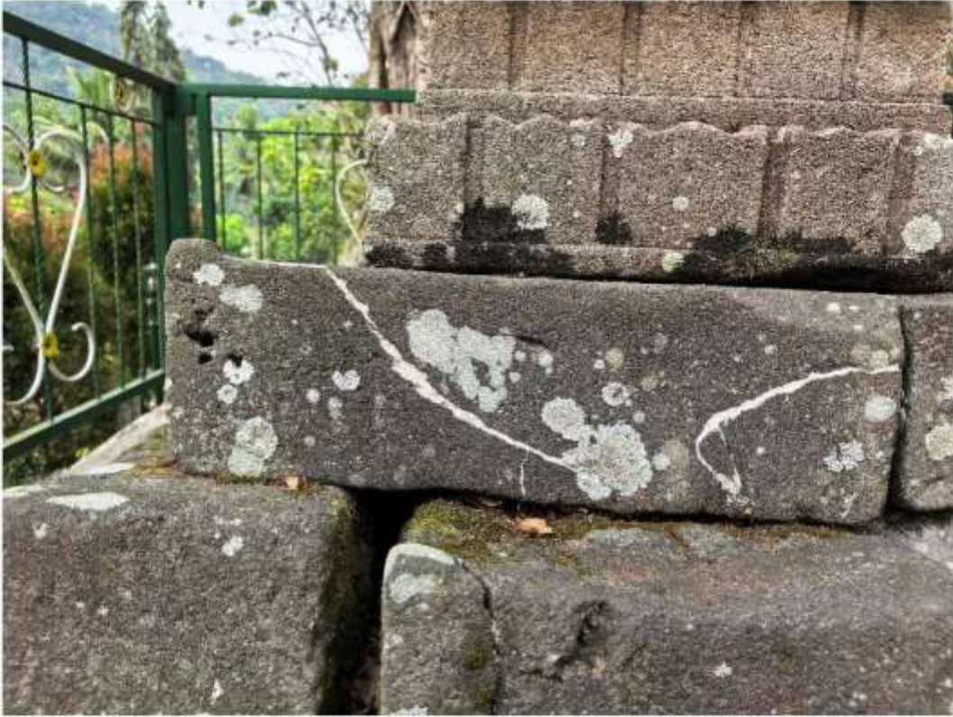
Foto 6. Komponen Batu Candi 6 Bagian Sudut Struktur Candi Pringtali tampak atas