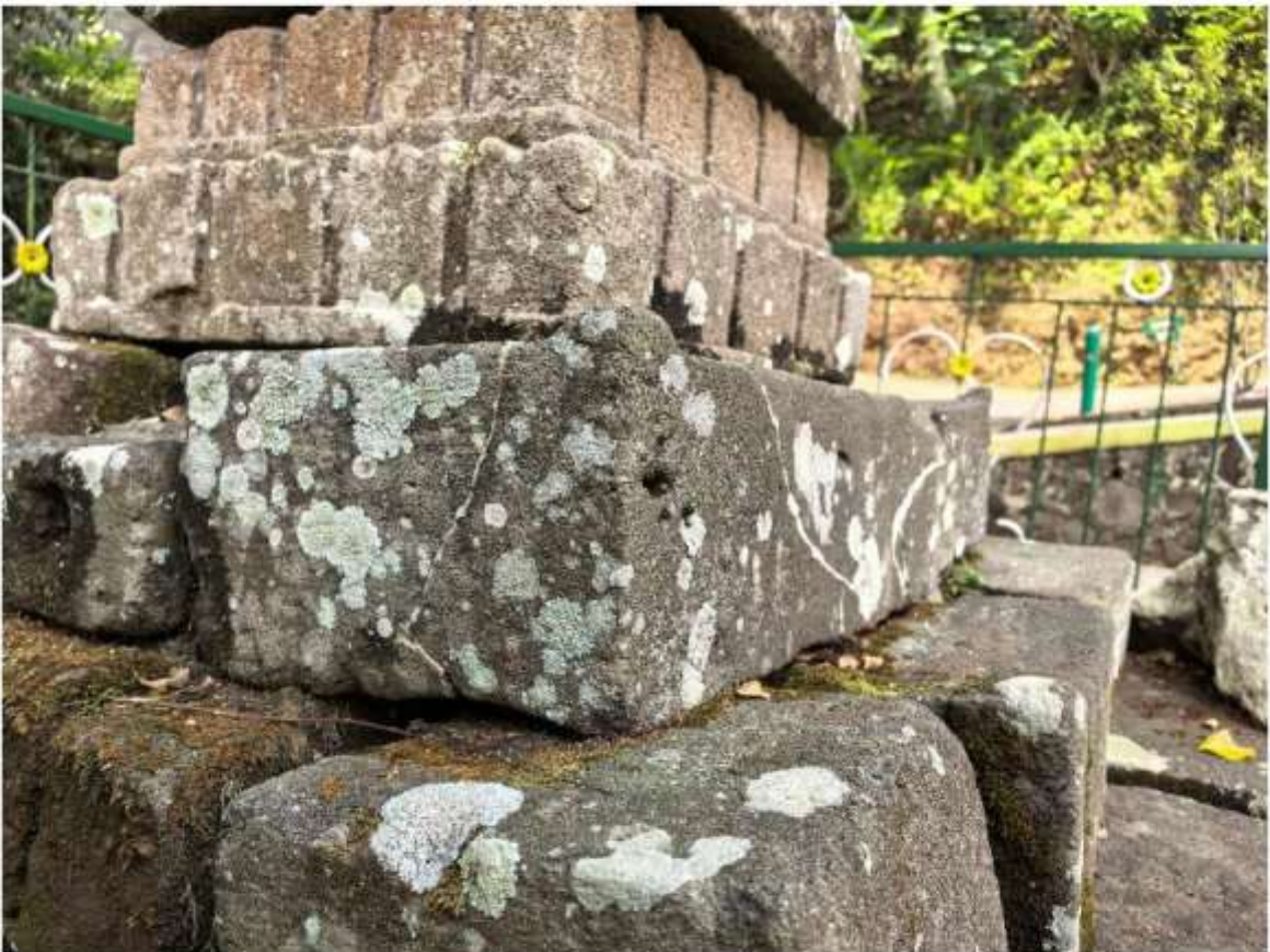
Foto 5. Komponen Batu Candi 6 Bagian Sudut Struktur Candi Pringtali