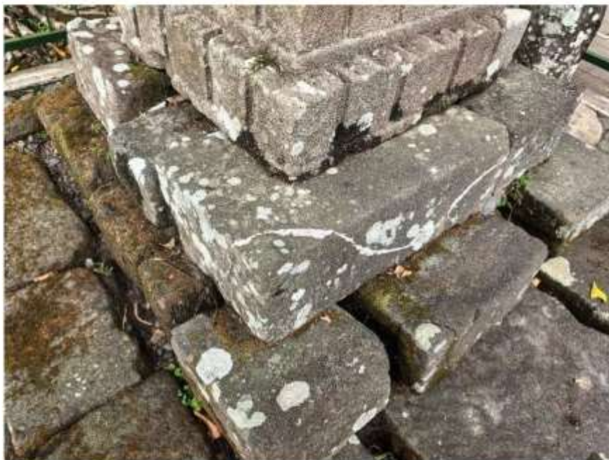
Foto 1. Komponen Batu Candi 6 Bagian Sudut Struktur Candi Pringtali