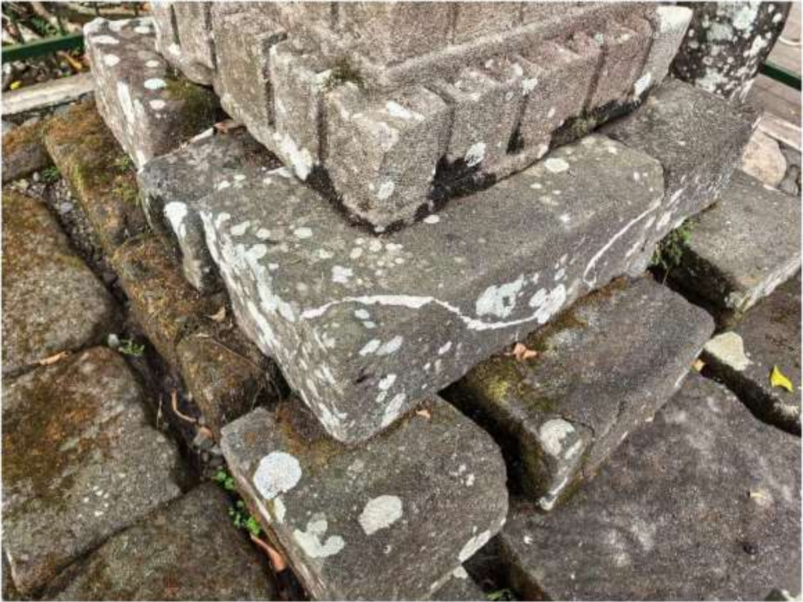
Foto 4. Komponen Batu Candi 6 Bagian Sudut Struktur Candi Pringtali