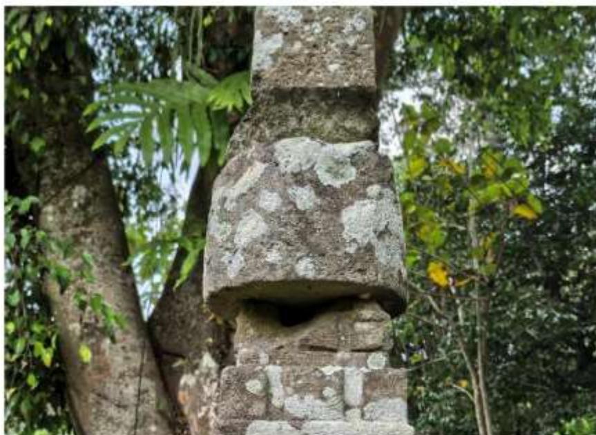
Foto 4. Komponen Batu Candi 7 Bagian Kemuncak Struktur Candi Pringtali