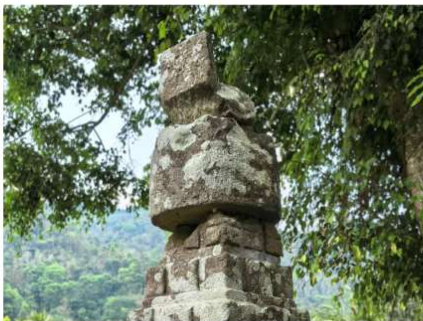
Foto 1. Komponen Batu Candi 7 Bagian Kemuncak Struktur Candi Pringtali Sumber: Dinas Kebudayaan ( Kundha Kabudayan ) Kab. Kulon Progo, 2025