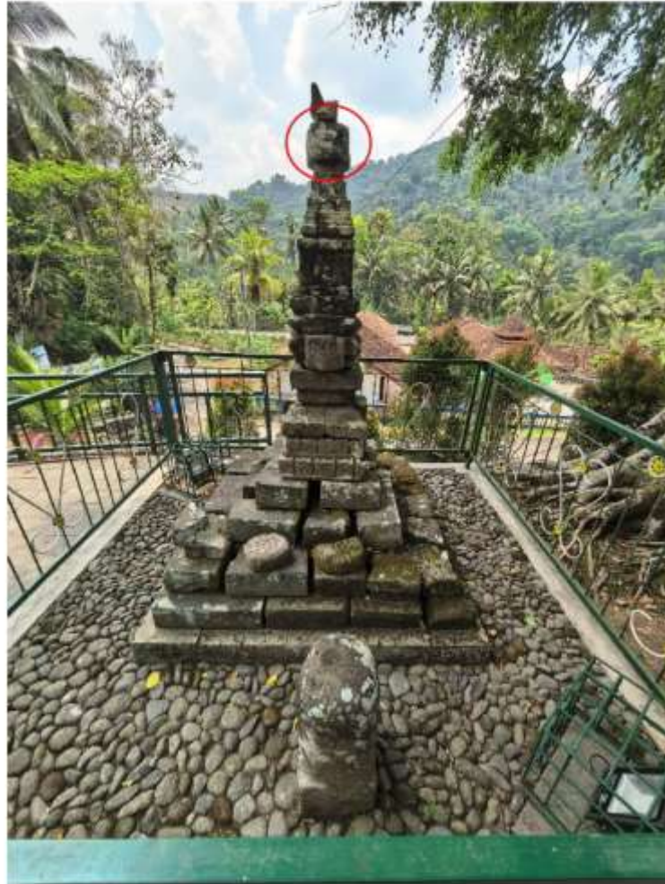
Foto 3. Komponen Batu Candi 7 Bagian Kemuncak Struktur Candi Pringtali (lingkaran merah)