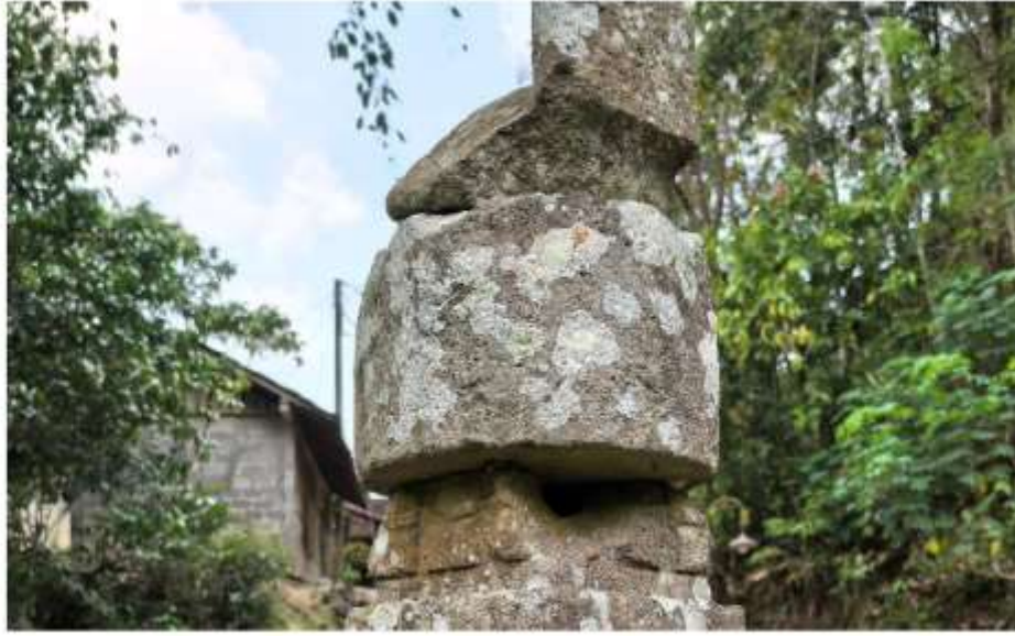
Foto 5. Komponen Batu Candi 7 Bagian Kemuncak Struktur Candi Pringtali