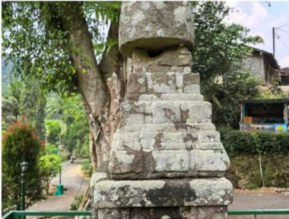
Foto 4. Komponen Batu Candi 1-A Bagian Atap Struktur Candi Pringtali