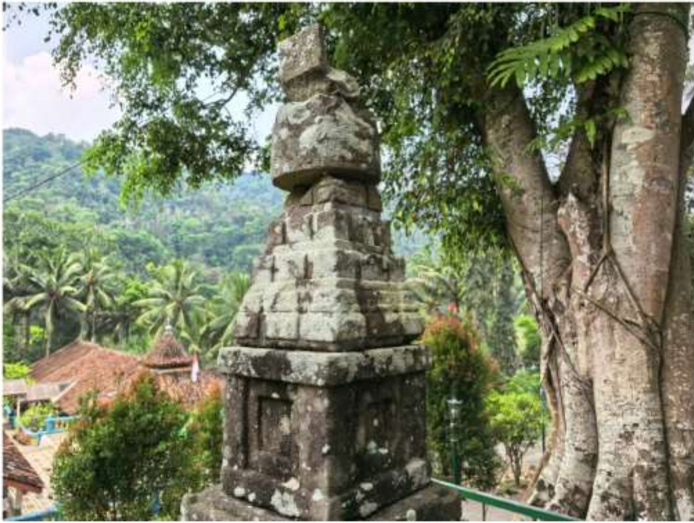
Foto 3. Komponen Batu Candi 1-A Bagian Atap Struktur Candi Pringtali