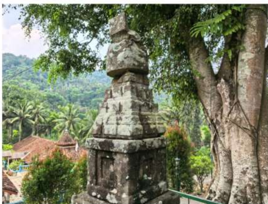
Foto 1. Komponen Batu Candi 1-A Bagian Atap Struktur Candi Pringtali