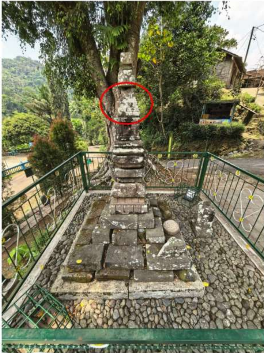
Foto 2. Komponen Batu Candi 1-A Bagian Atap Struktur Candi Pringtali dalam susunan struktur