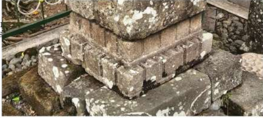
Foto 3. Komponen Batu Candi 2-A Bagian Atap Struktur Candi Pringtali