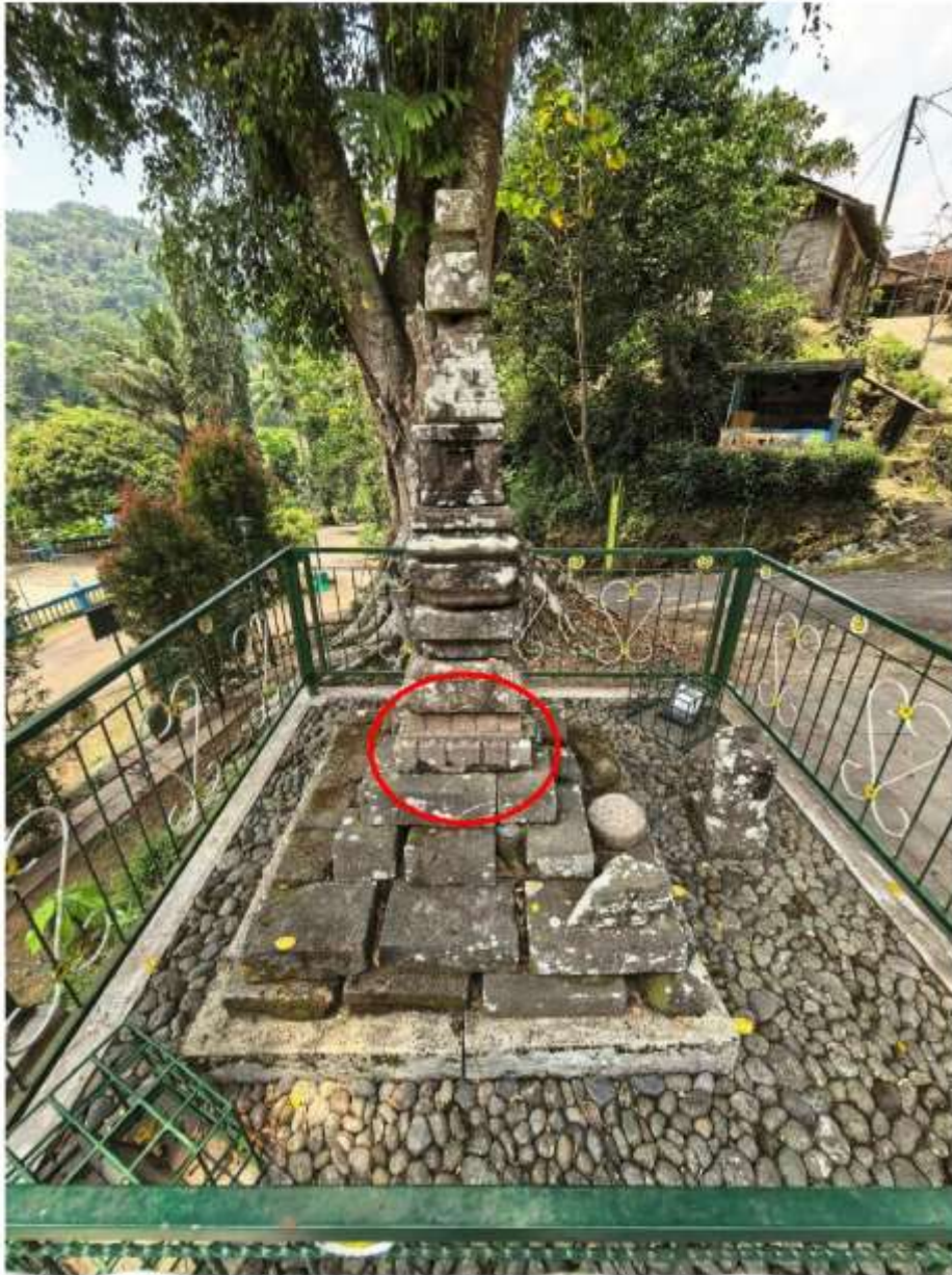
Foto 2. Komponen Batu Candi 2-A Bagian Atap Struktur Candi Pringtali dalam susunan struktur