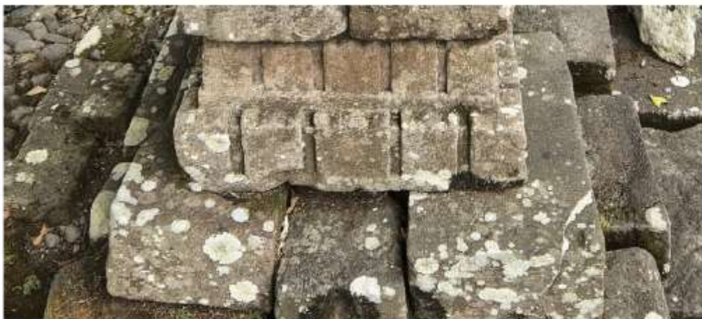
Foto 1. Komponen Batu Candi 2-A Bagian Atap Struktur Candi Pringtali