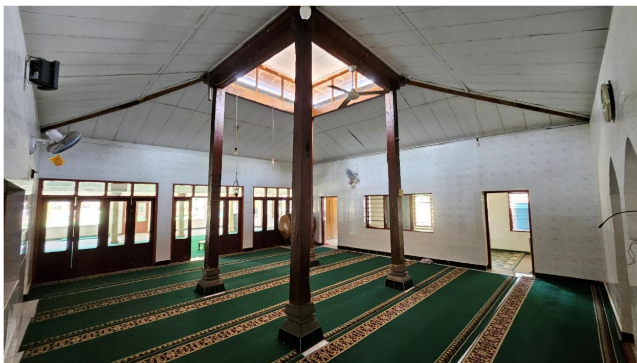
Foto 3. Struktur Saka Guru Masjid Kedondong (Sunan Kalijaga) dilihat dari barat laut