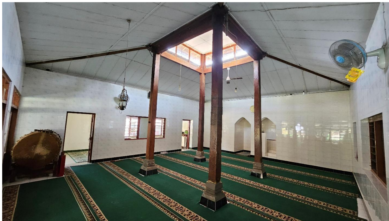
Foto 2. Struktur Saka Guru Masjid Kedondong (Sunan Kalijaga) dilihat dari timur laut