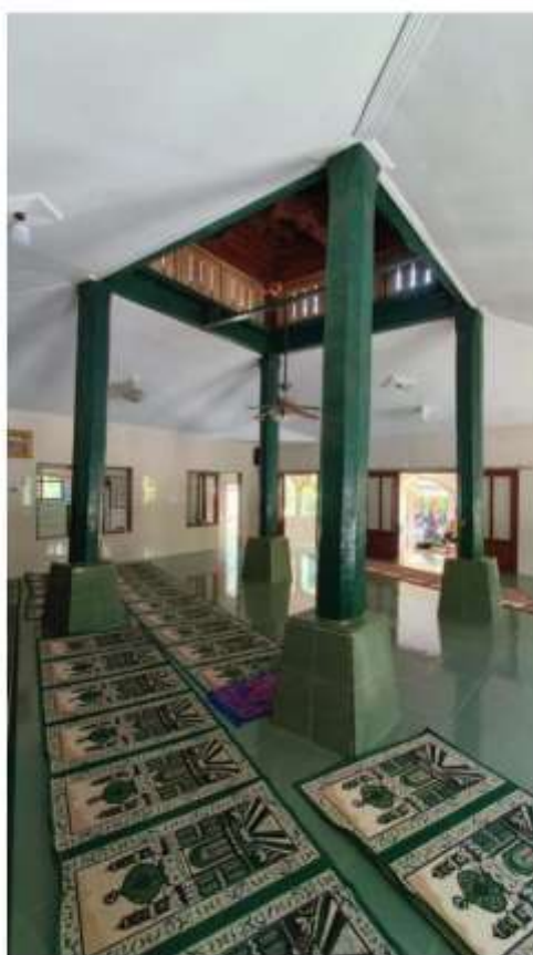
Foto 1. Struktur Saka Guru Masjid Al Muhajirin

Sumber: Dinas Kebudayaan ( Kundha Kabudayan ) Kab. Kulon Progo, 2025