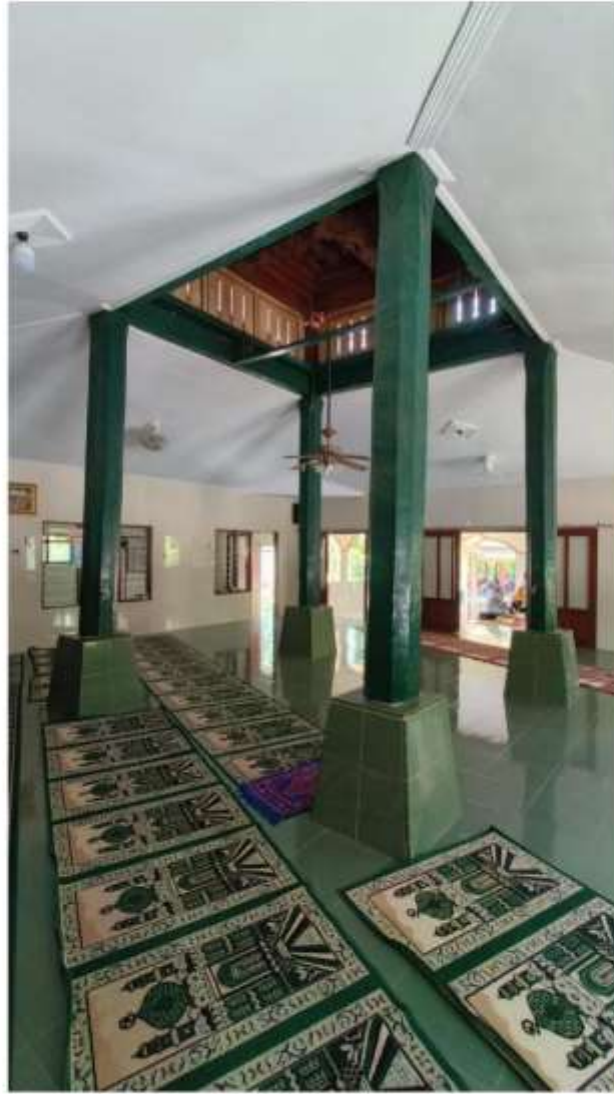
Foto 2. Struktur Saka Guru Masjid Al Muhajirin

Sumber: Dinas Kebudayaan ( Kundha Kabudayan ) Kab. Kulon Progo, 2025