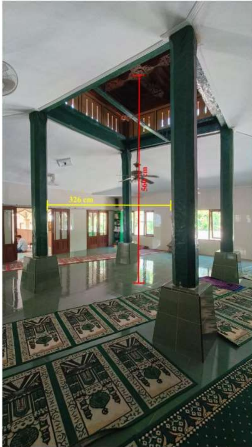
Foto 3. Ukuran Struktur Saka Guru Masjid Kedondong (Sunan Kalijaga) dilihat dari barat laut