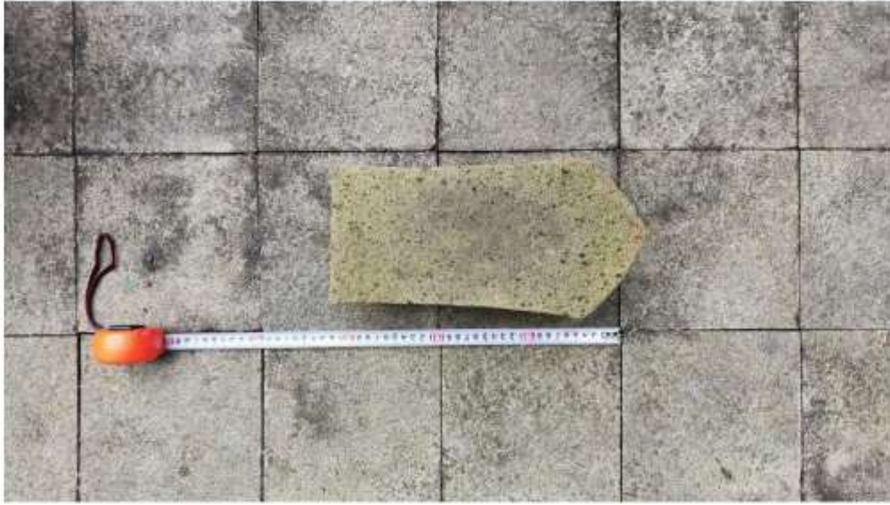
Foto 2. Pipisan Nomor Inventaris E.77i di Penampungan Gonotirto tampak atas