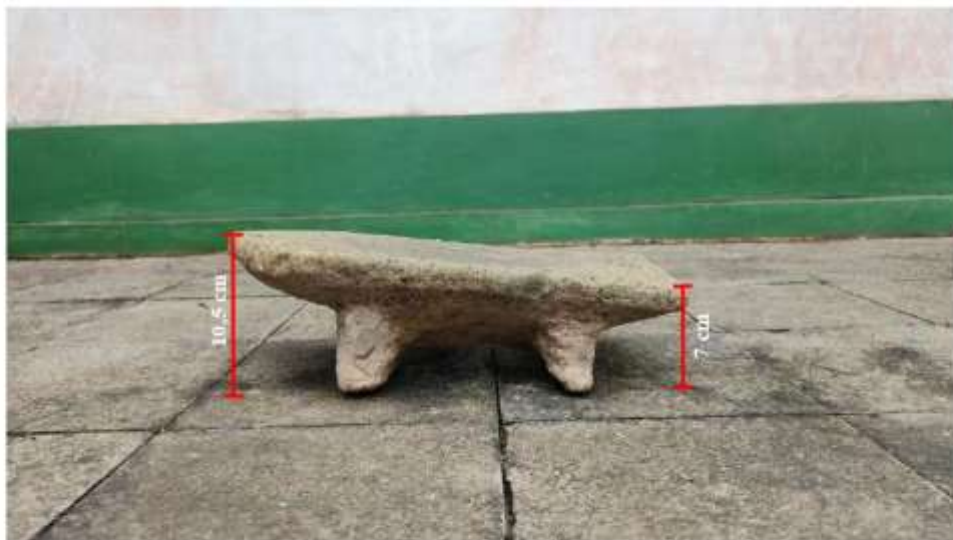
Foto 5. Ukuran tinggi Pipisan Nomor Inventaris E.77i di Penampungan Gonotirto