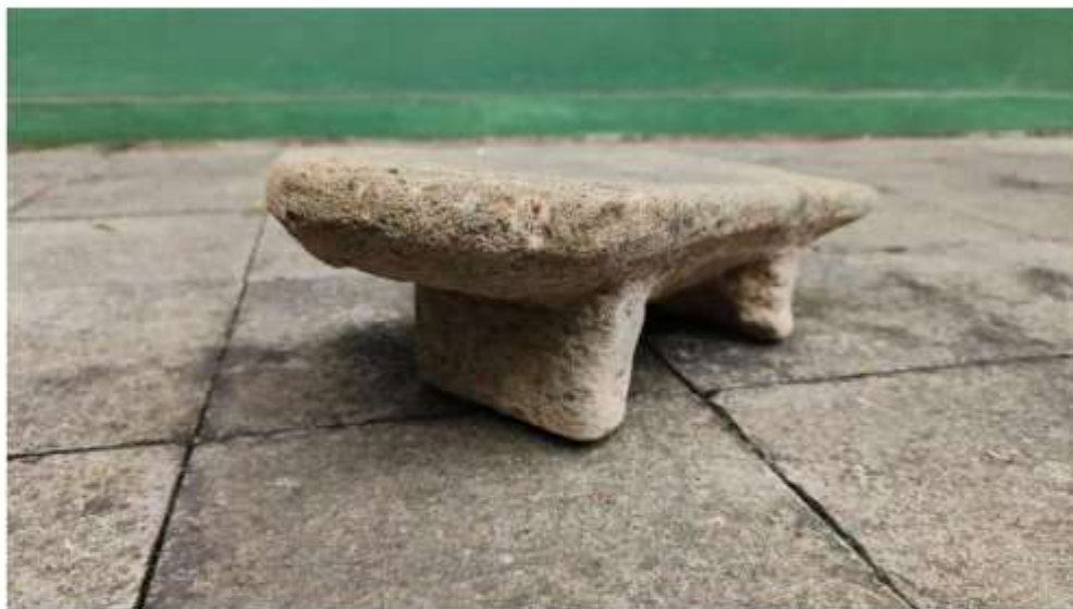
Foto 7. Pipisan Nomor Inventaris E.77i' di Penampungan Gonotirto tampak bagian depan