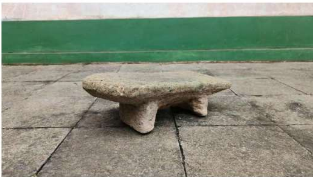
Foto 1. Pipisan Nomor Inventaris E.77i' di Penampungan Gonotirto