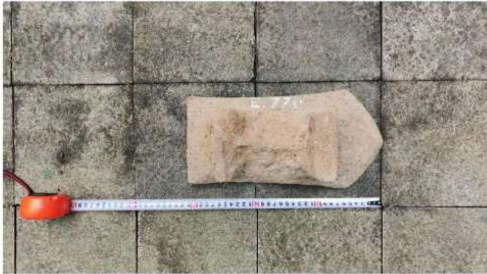
Foto 4. Pipisan Nomor Inventaris E.77i di Penampungan Gonotirto tampak belakang