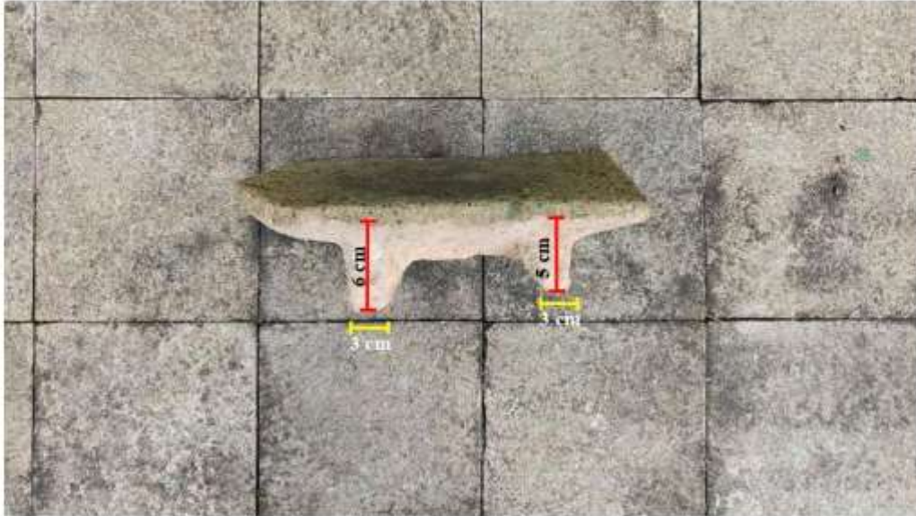
Foto 6. Ukuran kaki Pipisan Nomor Inventaris E.77i' di Penampungan Gonotirto