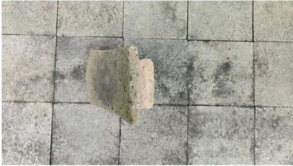
Foto 8. Pipisan Nomor Inventaris E.77i' di Penampungan Gonotirto tampak bagian belakang