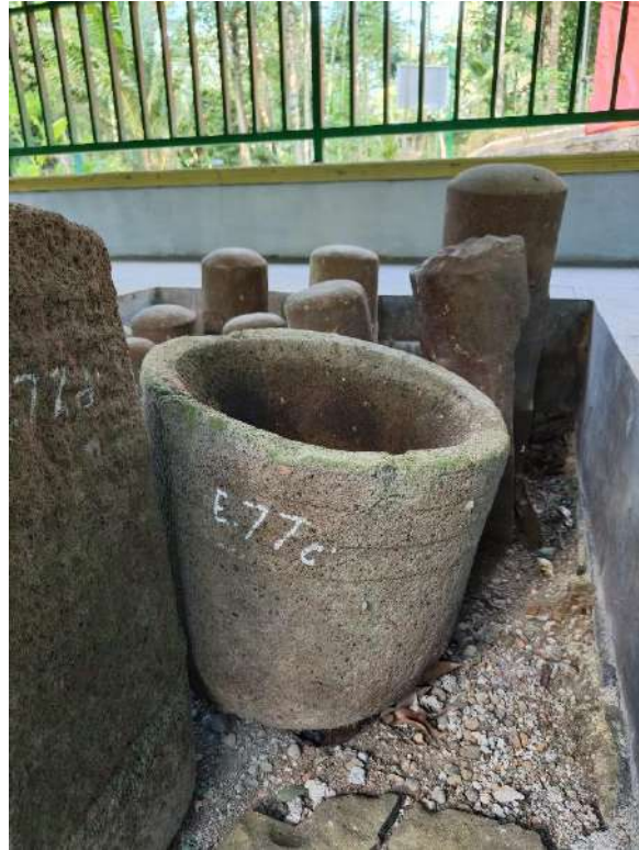
Foto 2. Lumpang Batu Nomor Inventaris E.77c' di Penampungan Gonotirto