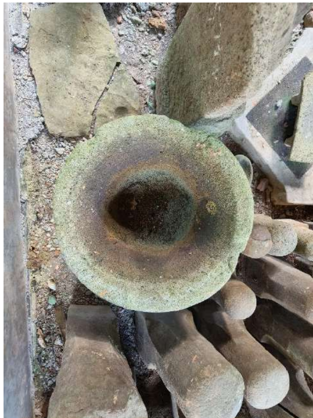
Foto 3. Lumpang Batu tampak dari atas