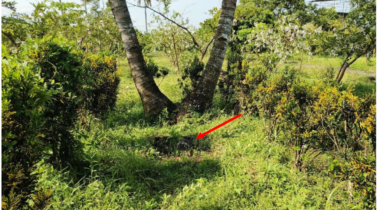
Foto 6. Kondisi eksisting lingkungan di sekitar Batu Tetenger