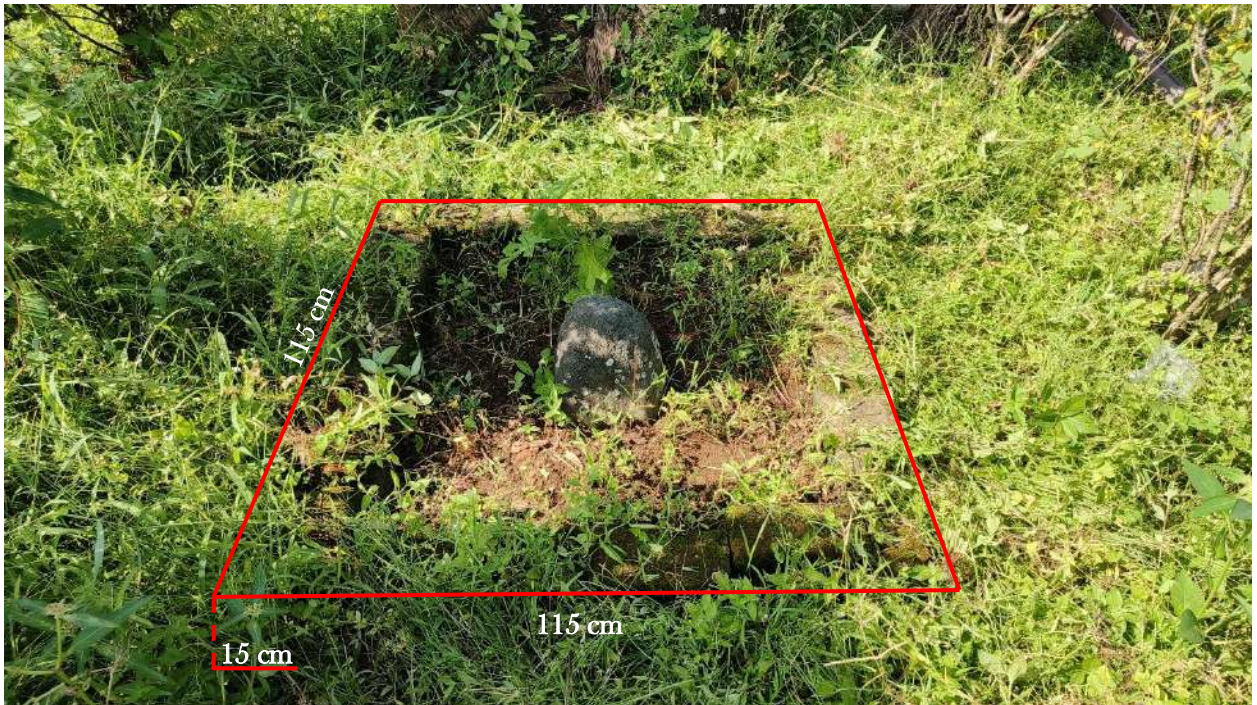
Foto 2. Batu Tetenger di Eks Pabrik Soember Nilo Tambak dengan pembatas dari pasangan batu bata