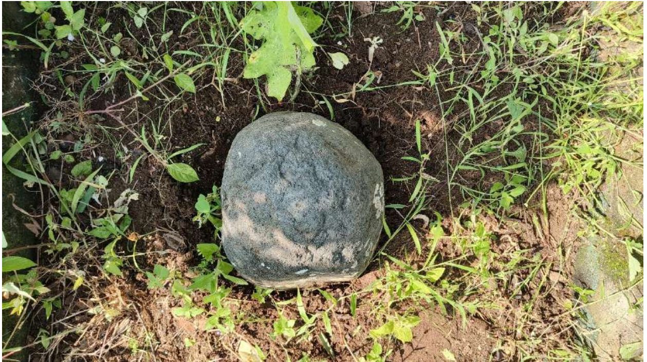
Foto 4. Batu Tetenger dilihat dari atas