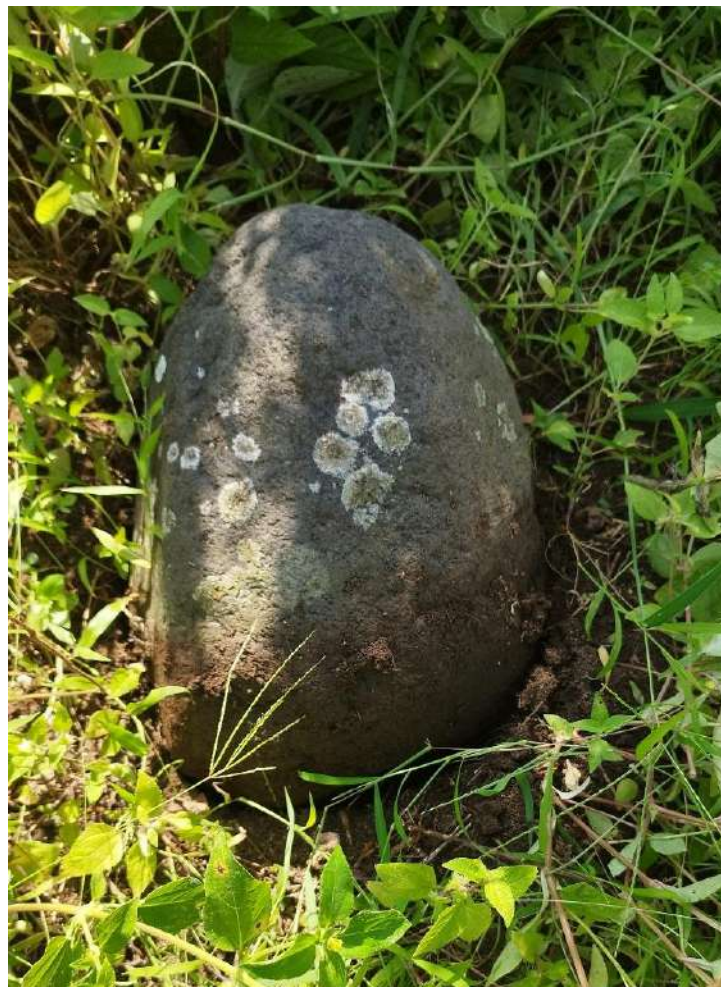
Foto 3. Tampak bagian Batu Tetenger secara keseluruhan

Sumber: Dinas Kebudayaan ( Kundha Kabudayan ) Kab. Kulon Progo, 2025