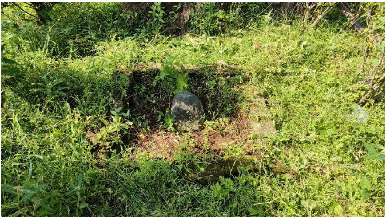
Foto 1. Batu Tetenger di Eks Pabrik Soember Nilo Tambak